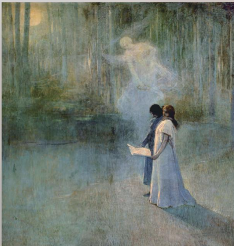
Canto de Amor. Julio Romero de Torres. 1905.